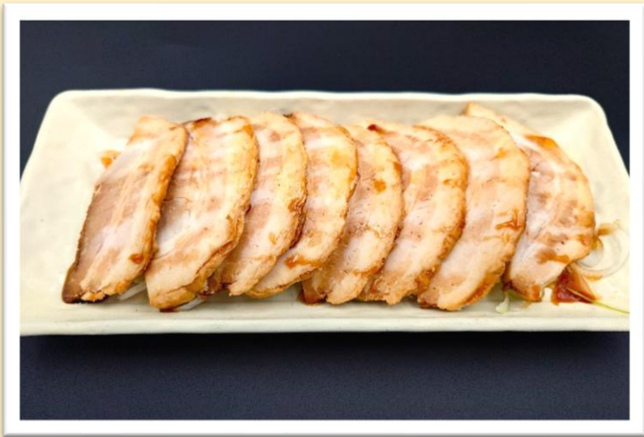
ねぎチャーシュー 800円